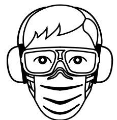
Bild 1. OBS! Vid kapning av sten ska skyddsglasögon, hörselskydd och andningskydd användas.

OBS! Följande beskrivningar gäller för fasta grundläggningsförhållanden, men är endast vägledande och ytterligare tekniska hänsyn kan behövas tas till geologiska variationer i tomt- och markförhållanden. Benders information är kostnadsfri och ska inte uppfattas som en detaljerad konstruktionsritning, men är ändå till stor hjälp vid byggnationen.